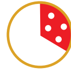
1/3 PIZZA CONSIGLIATA (corrisponde ad 1 pizza tradizionale)