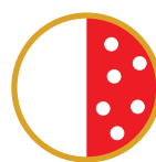
1/2 PIZZA NON CI VEDO PIU' DALLA FAME