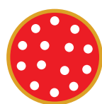
1 PIZZA LINUS LA GRANDE ABBUFFATA

LA PIZZA LINUS HA LA SUA MISURA SCEGLI IL FORMATO PIU' ADATTO AL TUO APPETITO