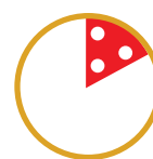
1/6 PIZZA PORZIONE BABY (solo per Menu Baby)

ALLERGENI: come disposto dalla Comunità Europea abbiamo indicato in grassetto i prodotti che rientrano tra gli allergeni. Vi informiamo inoltre che tutti i nostri salumi NON contengono: glutine, lattosio e nemmeno polifosfati