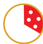
1/3 PIZZA CONSIGLIATA (corrisponde ad 1 pizza tradizionale)