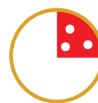
1/4 PIZZA HO VOGLIA DI QUALCOSA DI BUONO