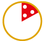
1/6 PIZZA PORZIONE BABY (solo per Menu Baby)

ALLERGENI: come disposto dalla Comunità Europea abbiamo indicato in grassetto i prodotti che rientrano tra gli allergeni. Vi informiamo inoltre che tutti i nostri salumi NON contengono: glutine, lattosio e nemmeno polifosfati