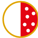
1/2 PIZZA NON CI VEDO PIU' DALLA FAME