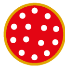
1 PIZZA LINUS LA GRANDE ABBUFFATA

LA PIZZA LINUS HA LA SUA MISURA SCEGLI IL FORMATO PIU' ADATTO AL TUO APPETITO