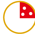
1/4 PIZZA HO VOGLIA DI QUALCOSA DI BUONO