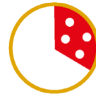
1/3 PIZZA CONSIGLIATA (corrisponde ad 1 pizza tradizionale)